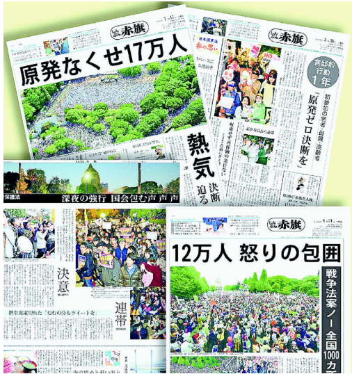
(写真上から時計回りに) 17万人が集まった「原発なくせ」署名集会(2017年7月7日付)、原発ゼロ官邸前行動1年(2017年3月30日付)、戦争法案「全国大行動」(2017年8月31日付)、秘密保護法強行に抗議(2013年12月10日付)を伝える「しんぶん赤旗」