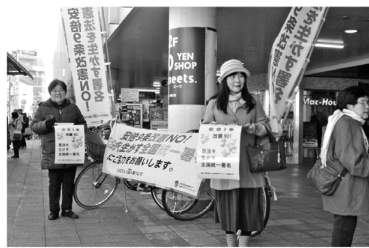
3000万人署名に取り組み兵庫県の「東園田の会」(2017年12月)

自民党は、憲法改定の発議を今年の国会でねらっています。「安倍改憲を許すな」と、全国で「3000万人署名」の運動が広がっています。各地の対話で出ている声や質問と結んで、Q&Aにまとめた100円パンフです。