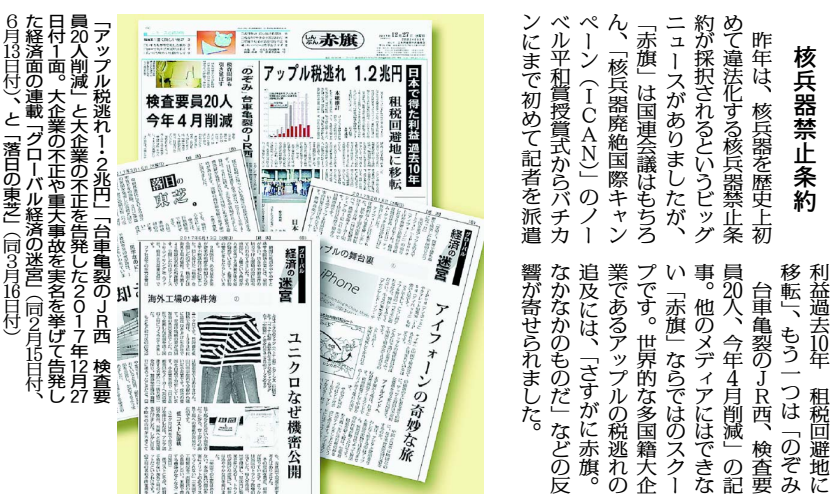
アップル税逃れ1.2兆円「台車電器のJ.R.西。検査要員20人、今年4月削減」と大企業不正を告発した2017年12月27日付1面。大企業の不正や車中事故を暴露して告発した経産省の連環「プロパゲンダ」の暴走(同月16日付、6月16日付)と「暴走」の暴走(同月16日付)

と絶対に負けられないたたかいつつ、歴史の瞬間の一部始終を伝えています。 このなかで、国際政治の主要な部分の多くは、新基地建設に反対するオールの全国紙として、安倍政権がいかにか民意も法も無視して新基地建設を強行しようとしているのか、その道理のなさをともに、立ち向かう沖縄の人々のたたかいを、全国紙のなかで、いちばん詳しく報道しています。 沖縄全域で相次ぐ米軍機事故は、普天間基地は市街地の真ん中にあるから危険だ。海辺の辺野浦に移せば安全だ。という、新基地建設の合理性論が、まったくの偽りであることを浮き彫りにしました。 移設条件つきではなく、普天間基地の無条件即時撤去こそ唯一の解決策であることを訴え、解決の展望を示してきた「赤旗」の役割は、きわめて重要になっていきます。 核兵器禁止条約 昨年は、核兵器を歴史上初めて違法化する核兵器禁止条約が採択されたというビッグニュースがありました。この「赤旗」は、国連会議はもうらん、「核兵器廃絶国際キャンペーン」(ICAN)のノーベル平和賞授賞式からパチパチにまで初めて記者を派遣した。 し、歴史の瞬間の一部始終を伝えています。 このなかで、国際政治の主要な部分の多くは、新基地建設に反対するオールの全国紙として、安倍政権がいかにか民意も法も無視して新基地建設を強行しようとしているのか、その道理のなさをともに、立ち向かう沖縄の人々のたたかいを、全国紙のなかで、いちばん詳しく報道しています。 沖縄全域で相次ぐ米軍機事故は、普天間基地は市街地の真ん中にあるから危険だ。海辺の辺野浦に移せば安全だ。という、新基地建設の合理性論が、まったくの偽りであることを浮き彫りにしました。 移設条件つきではなく、普天間基地の無条件即時撤去こそ唯一の解決策であることを訴え、解決の展望を示してきた「赤旗」の役割は、きわめて重要になっていきます。 大企業の不正 昨年は、大企業の不正事件や車中事故、談合や税逃れなどさまざまな事件が相次ぎましたが、この問題でなんの遠慮もなく、大企業の名を出して不正を追及できるのは「赤旗」です。 昨年12月27日付1面は大企業の不正を告発するスクープが紙面を飾りました。一つは、トップのアップル税逃れ1.2兆円。日本でも得た利益過去10年、租税回避地に移転、もう一つは「そのま台車電器のJ.R.西。検査要員20人、今年4月削減」の記事。他のメディアにはできない「赤旗」ならではのスクープです。世界的な多国籍大企業であるアップルの税逃れの追及には、「さすがに赤旗」なかなかのものだなどの反響が寄せられました。