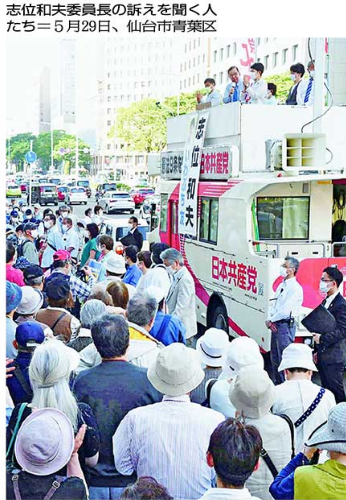
志位和夫委員長の訴えを聞く人たちは5月29日、仙台市青葉区